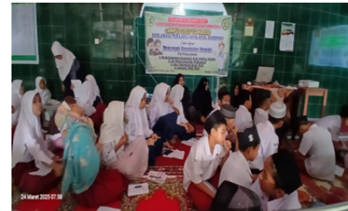
Gambar 3. Pengucapan Janji berakhlakul karimah

Telah terlaksana edukasi dan intervensi-berbasis-agama pada hari-Senin 24-Maret-2025 di Musholla-Kandis Rumah-Tigo-Ruang kota-Padang, yang dilakukan selama satu hari. Sebelum edukasi dilakukan post-test. Kemudian dilakukan edukasi dan intervensi-berbasis-agama. Kedua proses berjalan lancar dan sukses. Pada sesi diskusi dan tanya jawab, peserta yang bertanya dan menjawab dengan benar dan tepat diberi hadiah. Kemudian dilakukan post-test. Acara diakhiri dengan pemberian kenang2an kepada mitra. Tahapan-tahapan pelaksanaan PkM ini dapat dilihat dalam diagram alur Gambar 4. di bawah ini.