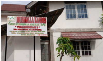
Gambar 1. Musholla-Kandis Rumah-Tigo-Ruang

membacakan janji dan sesudahnya. Analisis data secara deskriptif dan disajikan dengan narasi, tabel dan gambar. Musholla-Kandis Rumah-Tigo-Ruang, proses edukasi dan intervensi (pengucapan janji) sedang berlangsung terlihat pada Gambar 1., Gambar 2. dan Gambar 3. di bawah ini.