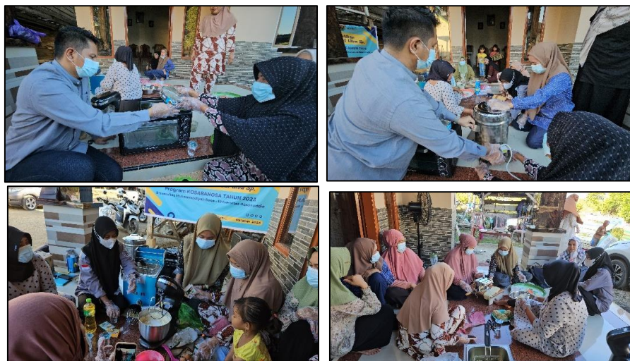
Gambar 3. Kegiatan Pelatihan

bersama mitra menggunakan microwave untuk memudahkan dalam pengeringan rumput laut, sehingga proses penghalusan menggunakan blender dapat dilakukan secara efisien. Antusiasme mitra selama pelaksanaan kegiatan pelatihan juga terlihat jelas, dimana mitra penasaran dengan proses pengolahan yang dilakukan dan selalu terlibat aktif pada setiap rangkaian tahapan yang dilaksanakan. Mitra Kelompok PKK Dusun Limpenno Kelurahan Toro dalam hal ini memiliki rasa ingin tahu yang tinggi. Setelah proses pembuatan tepung rumput laut, mitra secara aktif membuat beragam produk PMT yang dapat membantu dalam mencegah tengkes, seperti keripik dan nugget dengan bahan dasar tepung serbaguna dari rumput laut yang telah diolah sebelumnya.