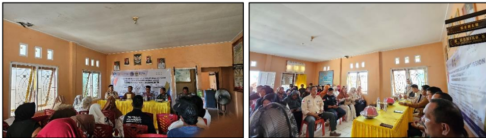
Gambar 2. Kegiatan Penyuluhan

Penyuluhan dilakukan dengan menggunakan metode pendekatan persuasif antara tim dengan mitra untuk menjalin chemsitry agar mitra antusias dalam mengikuti semua tahapan kegiatan (Asfar et al. , 2022; Rasmiati et al. , 2023). Kegiatan ini sangat membantu dalam proses transfer knowledge kepada mitra Kelompok PKK Dusun Limpenno Kelurahan Toro mengenai pentingnya budidaya dan pemanfaatan hasil budidaya rumput laut jenis Ulva sp. sebagai salah satu asupan gizi dalam mencegah tengkes . Pengolahan yang dilakukan difokuskan pada pembuatan tepung serbaguna dari rumput laut dalam membantu olah lanjut PMT guna mencegah tengkes. Pada kegiatan diskusi, anggota mitra merespons dan antusias dengan kegiatan yang dilakukan karena potensi rumput laut di Kelurahan Toro yang mumpuni dan kurang dieksplorasi selama ini. Mitra menyadari pentingnya pengolahan rumput laut dan signifikansinya sebagai salah satu asupan gizi yang dapat membantu dalam mencegah tengkes. Antusiasme mitra terlihat selama kegiatan berlangsung, dimana anggota mitra silih berganti mengajukan pertanyaan dan merespons setiap informasi yang diberikan.