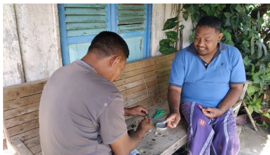
Gambar 2. Kegiatan Perakitan Lampu Sederhana

Pada sesi pelatihan, masyarakat dilibatkan secara langsung dalam proses perakitan lampu sederhana menggunakan bahan yang mudah diperoleh di lingkungan sekitar. Setiap tahapan pembuatan dijelaskan dan didemonstrasikan oleh tim pelaksana, kemudian diikuti oleh peserta dengan pendampingan. Kegiatan praktik ini membantu masyarakat memahami proses pembuatan secara menyeluruh meskipun tanpa dukungan modul tertulis.