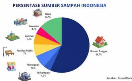
Gambar 1. Presentasi Sumber Sampah Indonesia

Issue pengelolaan sampah adalah salah satu isu lingkungan mendesak di seluruh kota di Indonesia. Seiring dengan peningkatan jumlah penduduk, konsumsi masyarakat, serta keterbatasan lahan menyebabkan volume sampah terus meningkat signifikan dari tahun ke tahun. Berdasarkan data Sistem Informasi Pengelolaan Sampah Nasional (SIPSN) Kementerian Lingkungan Hidup dan Kehutanan (KLHK) pada tahun 2025, terdapat 56,7% sampah berasal dari aktivitas rumah tangga dan kemudian disusul 13,7% dari aktivitas pasar (SIPSN, 2026). Sedangkan kemampuan pengelolaan sampah nasional baru mencapai 25% atau sekitar 36.684 ton per hari, sementara 75% lainnya (105.483 ton per hari) belum tertangani secara memadai dan masih beresiko mencemari lingkungan (KLH, 2026).