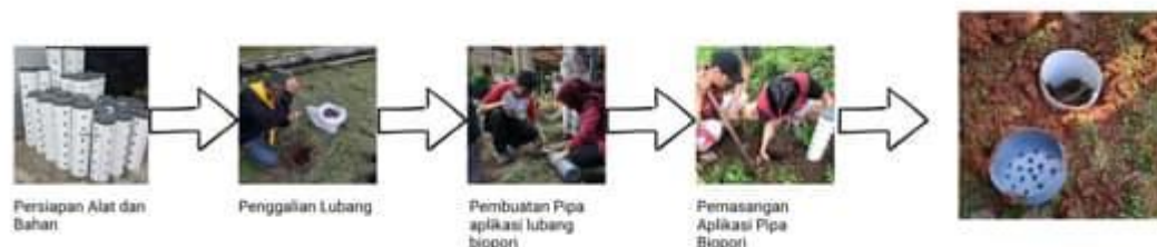
Gambar 4. Tahapan pemasangan pipa pada lubang biopori