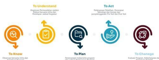
Gambar 3. Tahapan Pelaksanaan Kegiatan PKM

Lokasi pelaksanaan kegiatan pengabdian masyarakat di Kelurahan Bukit Wolio Indah, Kecamatan Wolio Kota Baubau. Mitra program kegiatan PKM ini adalah Kelompok Kebun Dapur Ibu (Kedai) Sabuah, terletak di Kelurahan Bukit Wolio Indah, berjarak 2,8 Kilometer dari Universitas Muhammadiyah Buton. Kedai Sabuah berada di atas lahan seluas 300 m 2 dan dipimpin oleh Pak Salihi yang merupakan seorang pensiunan PNS dan kelompok beranggotakan 25 orang. Kedai Sabuah adalah upaya pemanfaatan lahan pekarangan dan untuk pemberdayaan masyarakat di Kelurahan Bukit Wolio Indah. Pelaksanaan kegiatan secara keseluruhan diikuti oleh 30 Orang. Kegiatan ini dilaksanakan melalui beberapa tahapan, yaitu sebagai berikut: