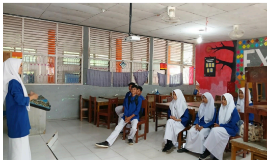
Gambar 2. Kegiatan English Club

Secara keseluruhan, program English Club ini merupakan upaya strategis dalam menjawab kebutuhan pendidikan bahasa Inggris di era globalisasi. Dengan metode pelaksanaan yang terstruktur, berbagai aktivitas yang menarik, dan pendampingan intensif, program ini dirancang untuk memberikan dampak positif yang maksimal bagi perkembangan kemampuan bahasa Inggris siswa SMAN 1 Nan Sabaris..