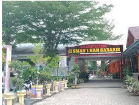
Gambar 1. Halaman Depan Sekolah

Kegiatan English Club dilaksanakan dua minggu sekali selama enam bulan, yang dirancang agar siswa memiliki waktu cukup untuk mempersiapkan materi dan berlatih berbagai keterampilan bahasa sebelum setiap pertemuan. Dalam pelaksanaannya, program ini menghadirkan beragam aktivitas berbahasa Inggris seperti pembacaan puisi, pidato, bernyanyi lagu berbahasa Inggris, membaca berita, cerita, dan debat, yang semuanya bertujuan mengasah kemampuan bahasa secara praktis dalam suasana yang menyenangkan dan mendukung.